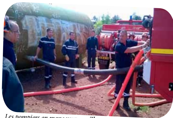
Les pompiers en manoeuvre au Thoronet.

Fort heureusement ce n'était qu'une manœuvre. Imaginez que le même incident se produise un jour d'été où le feu mange bien. Il aurait pu y avoir un groupe d'attaque en réel danger et nous aurions pu regretter un véritable drame.