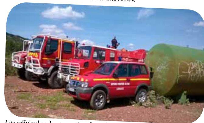
Les véhicules des pompiers lors de la manoeuvre d'entraînement à Peygros.